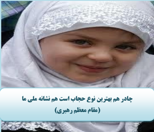
چادر هم بهترین نوع حجاب است هم نشانه ملی ما (مقام معظم رهبری)